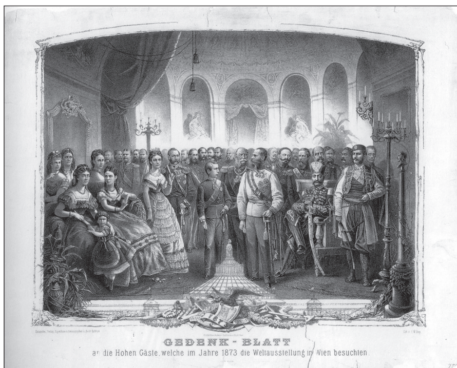
Плакета у спомен Велике светске изложбе у Бечу 1873.

ра књаза Николе, величајног и аутентичног „Другог“, истиче се у пуном сјају, отмености и достојанству у церемонијалном простору слике, симболичном простору царства. Она је презентација уважавања Књаза лично, али и колективног идентитета Црногораца. То поштовање, иако се мора тумачити првенствено у оквиру ондашњих политичких и територијалних претензија Монархије, припада и личним државничким способностима Књаза, као и његовим прецима који су традиционално походили Беч од 1715 (када је у њему био владика Данило), извршавајући државничке дужности и покушавајући да остваре неку добробит за своју земљу. Оно је, великим делом, проистекло и из ауторитета који је у Европи имао Његош, као владика и као песник.