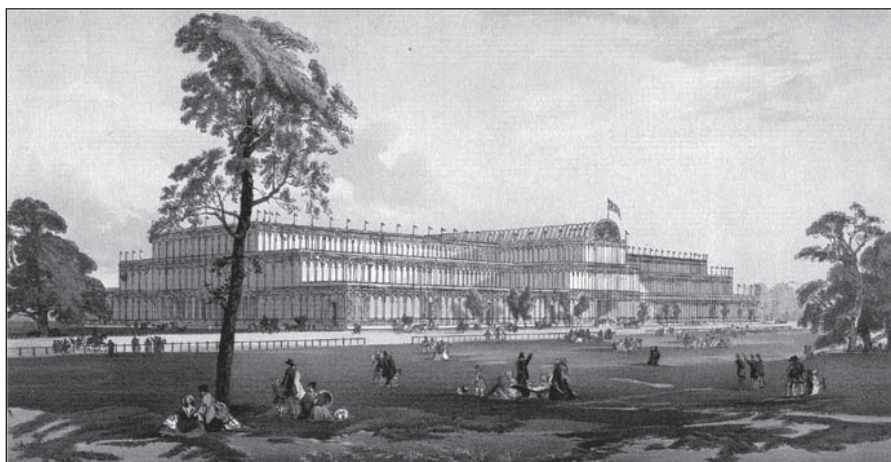
Crystal Palace, Лондон

„Кристални палац“, конструкција од челика, дрвета и стакла, подигнута је за потребе Велике светске изложбе 1851. у Лондону. Ово чудо ондашње науке и технике симболизовало је Лондон као центар модерног света и капиталистичког поретка, којем је, као таквом, припадало да буде домаћин прве интернационалне смотре достигнућа науке и технике, уметности и културе, производње и конзумирања. 2 Том манифестацијом започела је серија l'exposition universelle , које су, и поред промене контекста, увек биле својеврсни форум на којем се потврђивао владајући економско-политички поредак, иницирала нова економска и социјална стремљења, склапали и расклапали међународни односи, огледали друштвени и културни феномени.