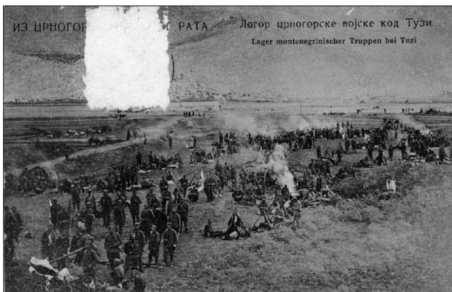
Сл. 8. Васо Радуловић, Логор црногорске војске код Тузи