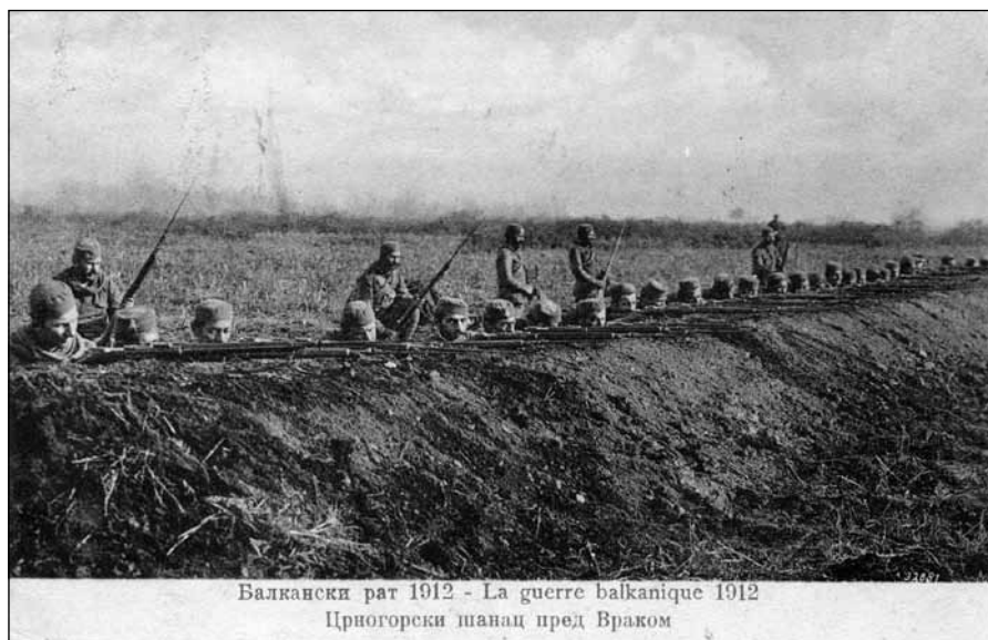
Сл. 6. Васо Радуловић, Балкански рат, Црногорски шанац пред Враком - колекција Ј. В.