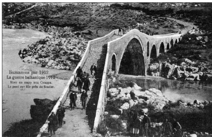
Сл. 5. Васо Радловић, Мост на Киру код Скадра - колекција Ј. В.