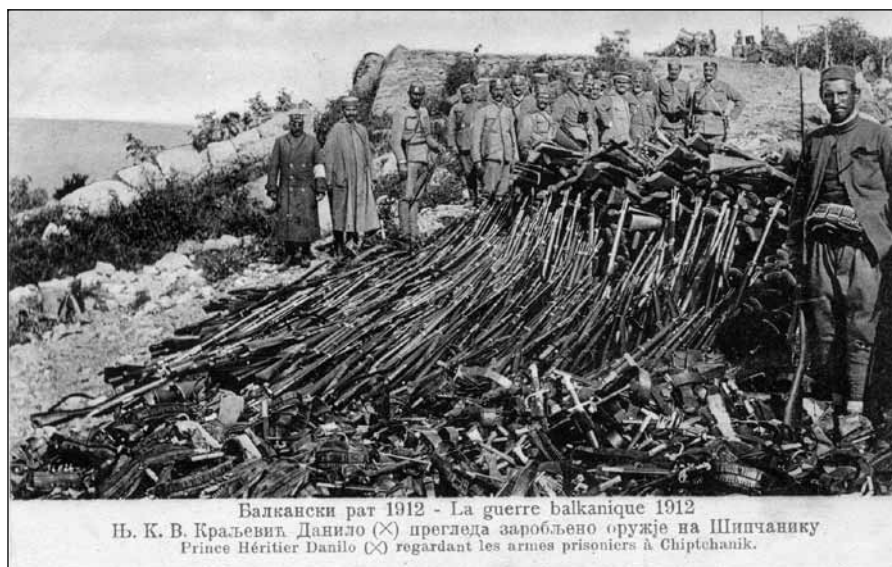
Сл. 7. Васо Радуловић, Краљевић Данило прегледа заробљено оружје на Шипчанику - колекција Ј. В.