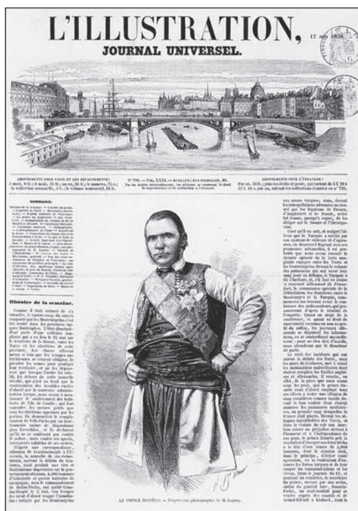
Le Prince Danilo de Montenegro

Иако су од 1855. до 1859. године атеље Ле Греја посјећивали и многи страни државници, што је свједочио о великом интересовању за нови медиј, куповна моћ споменуте публике била је мала. Видјевши да нови изум не обећава нарочиту зараду, финансијери Ле Греја и браће Бисон су повукли свој капитал. Због недостатка трговачког духа и сигурних прихода, убрзо након тога Ле Греј и браћа Бисон су присиљени да затворе своје радње. 33