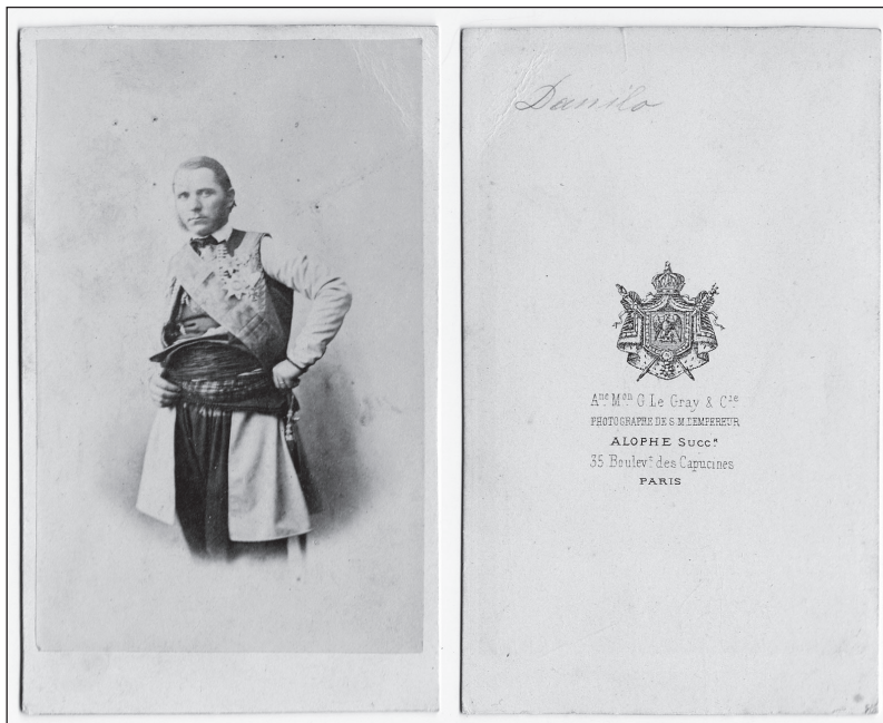
14. G. L Grey- Alophe Succ, књаз Данило, албуминска фотографија, друга половина 19. вијека ( 1885?)

Док мирује, ова физиономија је мирна, хладна, загонетна; одражава неповјерљив и унеколико дефанзиван став који имају готово сви источњачки књезови, окружени опасностима и издајама. Код њих се лукавост крије испод равнодушности, рекао бих готово службене дремљивости; код Данила, испод једноставности. Његова ријеч је лака, присна и сликовита. На најмање противречење или усљед неког веома јаког осјећања, његове плавкасто-сиве очи заискре попут муње, и венама младог ђака Петра Великог проструји стара црногорска крв. 30