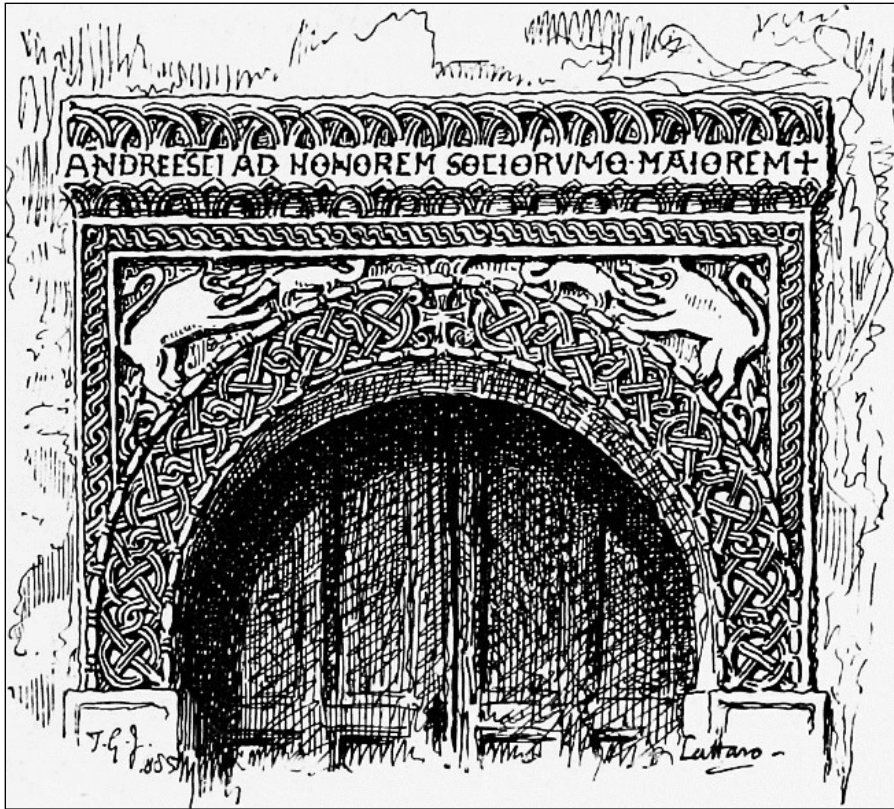
Цртеж бр. 1 (T. G. Jackson, The Dalmatia, the Quarnero and the Istria , III, Oxford, 1887, 43, сл. 74)

У цјелини сачувана страница са текстом ANDREE SANCTI AD HONOREM SOCIORVMQ MAIOREM+ све до 1966. године налазила се изнад једних врата која су из сакристије водила у катедралу. Цртеж са њеним изгледом и положајем у катедрали са краја XIX вијека оставио је енглески историчар T. G. Jackson , (Цртеж бр 1). 3