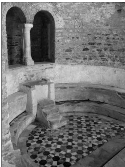
Sl. 7. Crkva Sta Maria delle Grazie u Gradu, opus sectile u apsidi