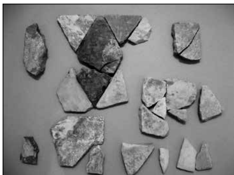
Sl. 5. Ulomci opus sectile iz svetišta trogirске katedrale

ulaska u podzemni hodnik postojala sve do 18. st., kada je pri gradnji kasnobaroknog oltara prekriven kameni poklopac. 3