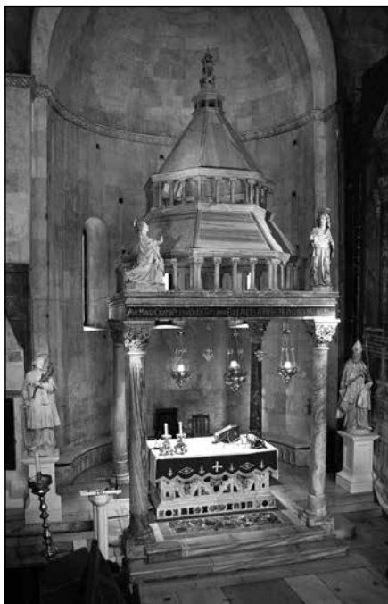
Sl. 1. Katedrala sv. Lovre u Trogiru, pogled na glavni oltar s ciborijem