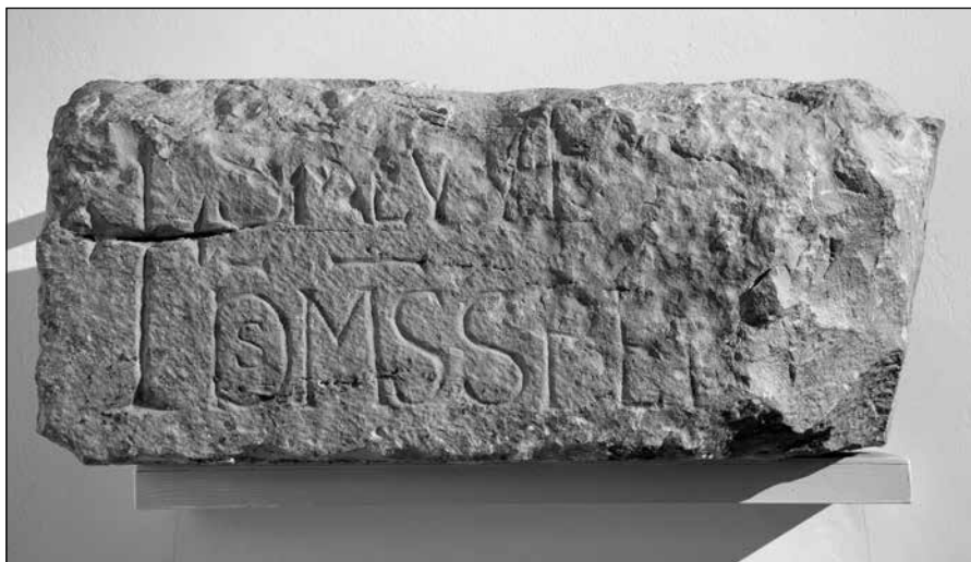
Sl. 10. Fragment ranokršćanskog nadvratnika iz benediktinskog samostana sv. Nikole u Trogiru s tekstom psalma

maničke crkve sv. Dujma u samostanu benediktinki, u ranoromaničkoj crkvi sv. Barbare i u romaničkoj crkvi sv. Ivana Krstitelja u neposrednoj blizini katedrale. 15