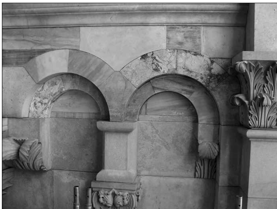
Sl. 14. Antički mramorni fragmenti u zvoniku splitske katedrale

SALVVM [fac servum tuum], D[eu]S M[eu]S SPER[antem in te] Spasi slugu svog, Bože moj, koji se u Te uzda