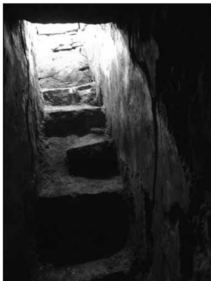
Sl. 2. Ulazni hodnik u konfesiju trogirске katedrale

od nastanka do ranog 15. stoljeća više puta je opasan zidinama koje rastu u koncentričnim pojasevima. U kasnoantičkim i srednjovjekovnim izvorima spominje se kao civitas iako tada još nije imao status biskupije. Uz glavni gradski trg smještena je romanička katedrala sv. Lovre, u sjeveroistočnoj četvrti, i nešto južnije benediktinska crkva sv. Ivana Krstitelja, u jugoistočnoj četvrti Trogira. Dosadašnji istraživači trogirskog urbanizma smatrali su da je katedrala zadržala kontinuitet kulturnog mjesta na temeljima ranokršćanske crkve. 2