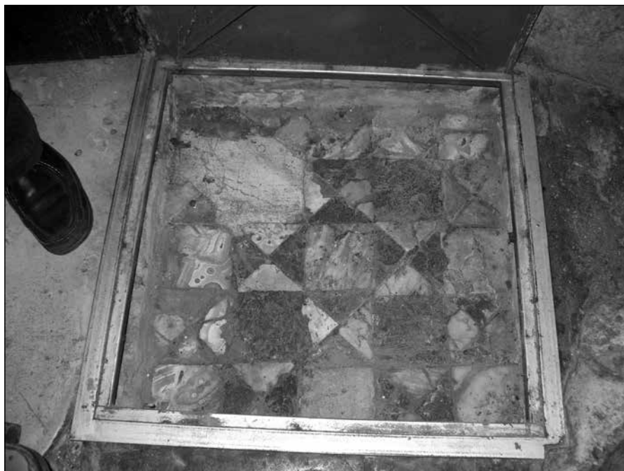
Sl. 6. Fragment pločnika u tehnici opus sectile iz splitske katedrale (Dioklecijanov mauzolej)

formirali pločnik svetišta u tehnici opus sectile marmoreum i u trogirskoj katedrali. Pločice ( crustae ) pronađene su razbacane u prezbiteriju u sloju iznad velikih ploča koje pokrivaju hodnik konfesije. Po značaju u liturgiji, ovaj najsvetiji dio crkvenog prostora trebao je pokazati važnost u odabiru i bogatstvu materijala. Među pločicama se izdvajaju crni neprozirni rombovi od diorita i trokuti od bijelog penteličkog i sivog prokoneškog mramora, pavonazetta i tamnocrvenog mramora koji su formirali jednostavnu geometrijsku shemu ispunjenu precioznim intarzijama. Obližnja Salona, glavni grad provincije Dalmacije, kao i carska palača u Splitu na istočnom kraju velikog zaljeva, bile su pogodne destinacije za uvoz mramora sa cijelog područja Sredozemlja, a narudžbe za skulpture, sarkofage, stupove i oplata stizale su i iz drugih centara. Najveći dio potreba za arhitektonskim klesanim kamenom u ovom dijelu provincije ispunjavali su carski kamenolomi kod Škripa na otoku Braču i oni u Segetu kod Trogira, za koji Plinije Stariji navodi Tragurium civium Romanorum, marmore notum . 6