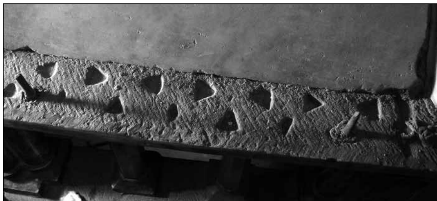
Sl. 13. Fragment predomaničke oltarne pregrade ugrađen u konstrukciji ciborija

mučenik Lovro arhiđakon”. Iako su ostaci mučenika Lovre počivali u Rimu, a njegova se crkva uz onu sv. Petra, sv. Pavla i sv. Mariju Maggiore ubrajala u sve hodočasničke itinerere, u Trogir su vjerojatno donesene relikvije za posvetu ranokršćanske crkve. Relikvije sv. Lovre mogle su biti položene u trogirski confessio u doba velikog obnovitelja crkve u Dalmaciji salonitanskog biskupa Hesihija, a nakon trijumfnog pohoda regentice Galle Placidije koja, uz potporu Istočnog Carstva, uspostavlja kontinuitet teodozijanske dinastije u Ravenni. Teodozijeva je kći Galla Placidija, u predvorju crkve sv. Križa u Ravenni, podigla kapelu u obliku križa u kojoj je prikazan sv. Lovro kao uskrslı svetac, s križem na ramenu pored gorućih gradela atributa njegova mučeništva. 22