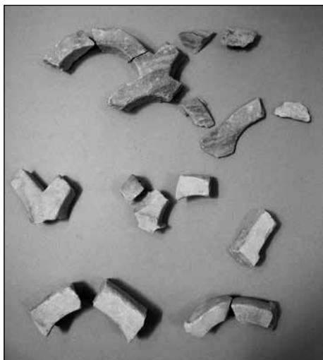
Sl. 4. Ulomci mramornih tranzena pronadjeni uz konfesiju