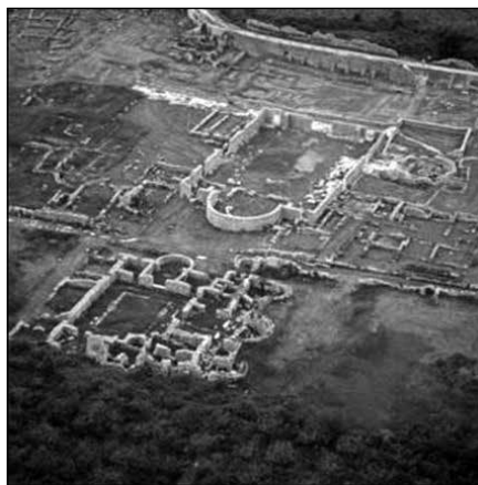
Sl. 8. Episkopalni centar u Salonici

i trokutastih mramornih polja ( sectilia marmorea ) 7 u efektinom kolorističkom odnosu tamnog i svijetlog mramora. 8 Iako je Rotunda u Solunu građena u doba tetrarhije pretvorba u ranokršćansku Crkvu, provodi se za cara Teodozija, a bogati mozaični ukras unutrašnjosti crkve Hosios Georgios ukazuje na carsku naredbu i na značajnu prisutnost teodozijanske dinastije u Solunu prije odlaska u Ravenu. Otkriveni su fragmenti zidnog ukrasa u tehnici opus sectile , ali mramorne geometrijske podne intarzije svojstvene reprezentativnim građevinama nisu pronađene. 9