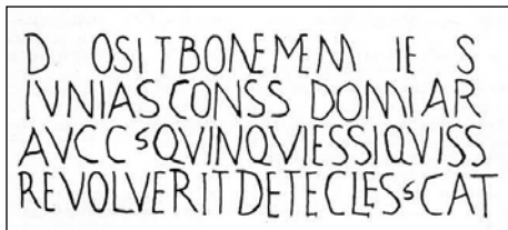
Sl. 9. Fragment sarkofaga s natpisom i spomenom ECLESS(ia) CAT(holica) iz Trogira

ci opus sectile pronađeni su u prostorijama ispod krstionice sv. Ivana Lateranskog, a datirani su nešto prije 300. godine, dakle u doba tetrarhije. Primjer istog tipa popločenja još u 19. stoljeću bio je vidljiv u Maksencijevoj bazilici u Rimu. 10 Rimska bazilika sv. Marka, 11 koja je podignuta prije sredine 4. stoljeća, imala je gotovo cijeli srednji brod popločan rasterom velikih dijagonalno položenih kvadrata s manjim upisanim kvadratom, a slična shema pripadala je građevini pod nartekсом bazilike sv. Sabine koja pripada prvoj polovici 4. stoljeća. 12