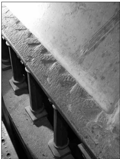
Sl. 12. Arhitrav predromaničke oltarne pregrade ugrađen u romanički ciborij trogirске katedrale

razinu književne i teološke kulture. Prilikom okupljanja vojske u Saloni za pohod protiv uzurpatora, na prijestolju Zapadnog Rimskog Carstva, Augustu Gallu Placidiju i njezina sina, budućeg cara Valentinijana III, svečano je dočekaо salonitanski biskup. 19