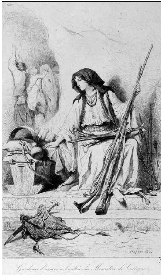
Sl. 1. Teodor Valerio, Čuvarka oružja, lula i kolvke pred Cetinjskim manastirom, bakropis, 1864

Crnogorske predstave Valerioa posebno je popularizovao Šarl Iriart (Charles Yriarte), francuski putopisac, grafičar i reporter ilustriranog časopisa Le Monde Illustré . Irijart je, pažljivo pripremljen, takode obišao Dalmaciju i Crnu Goru i 1878. objavio ilustrovani putopis Les bords de l'Adriatique et le Monténégro: Venise, la Istrie, Le Quarnero, la Dalmatie, le Monténégro et la rive Italienne , u kome je dao iscrpan prikaz života, ljudi i pejzaža istočne obale Jadrana. 13 U svom putopisu je objavio bakropise iz Valerioovih albuma La Dalmatie i Le Monténégro . Irijartove obrade Valerioovih crnogorskih tema objavljivane su u mnogim revijama, naročito u ilustriranom magazinu Il Giro del mondo (italijanskoj varijanti francuskog Le tour du monde, nou-