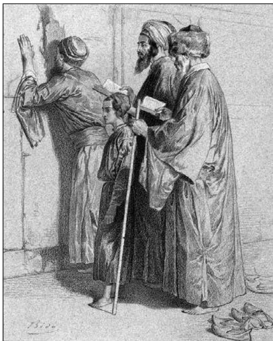
Sl. 3. Aleksandr Bida, Četvorica Jevreja pred Zidom plača , crtež, oko 1850

(Charles Le Brun) sistematizacije izražavanja emocija koristilo razrađeni repertoar poza, gestova i pokreta, 20 kojem je romantizam dodao povišenu osećajnost.