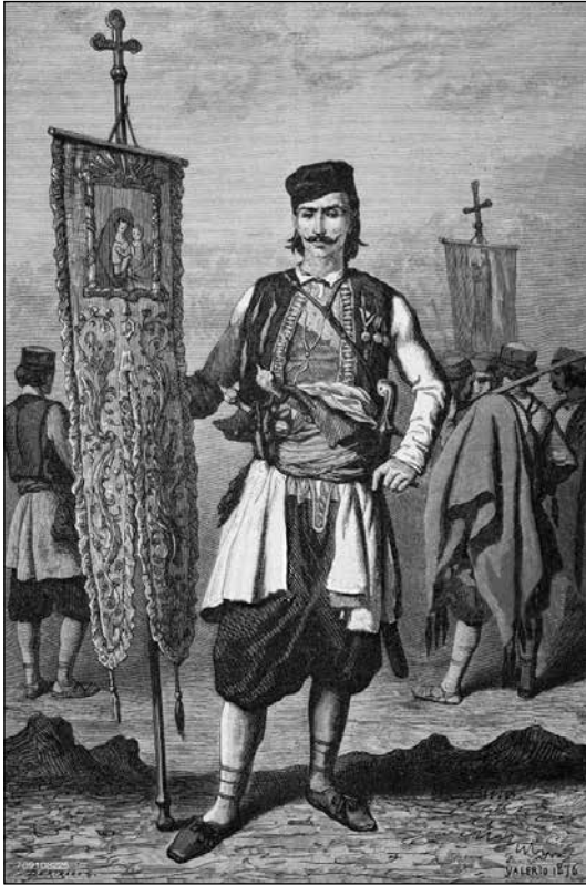
Sl. 5. Šarl Iriart prema Valeriu, Crnogorski sveštenik u ratničkoj uniformi sa crkvenim barjakom ( Il Giro del mondo , VI/19, ottobre 11, 1877)

Nestabilnost re-prezentacija Crnogoraca ogleda se i na Valerioovom bakropisu Le prêtre monténégrin en uniforme de combat, portant le drapeau de l'église (sl. 5). Crnogorski sveštenik u ratničkoj uniformi sa crkvenim barjakom postao je poznat ponovo zahvaljujući Irijartovoj interpretaciji objavljenoj u magazinu Il Giro del mondo (VI/19, ottobre 11 1877). U punoj figuri, okrenut pravo prema posmatraču, pozira Crnogorac u narodnom odeću (koje jeste ratnička uniforma ), koje su, zna se, nosili i crnogorski sveštenici. Njegovo lice je slično licima svih Irijartovih Crnogoraca – istovremeno antropološki tačno i idealizovano – oštrih crta, jakih veđa, tankog nosa i uredno uvis povijenih brkova, prodornog neustrašivog pogleda. Figura je visoka i tanka i, kao uvek, veoma elegantna. Svečana nošnja i oružje su verno predstavljene,