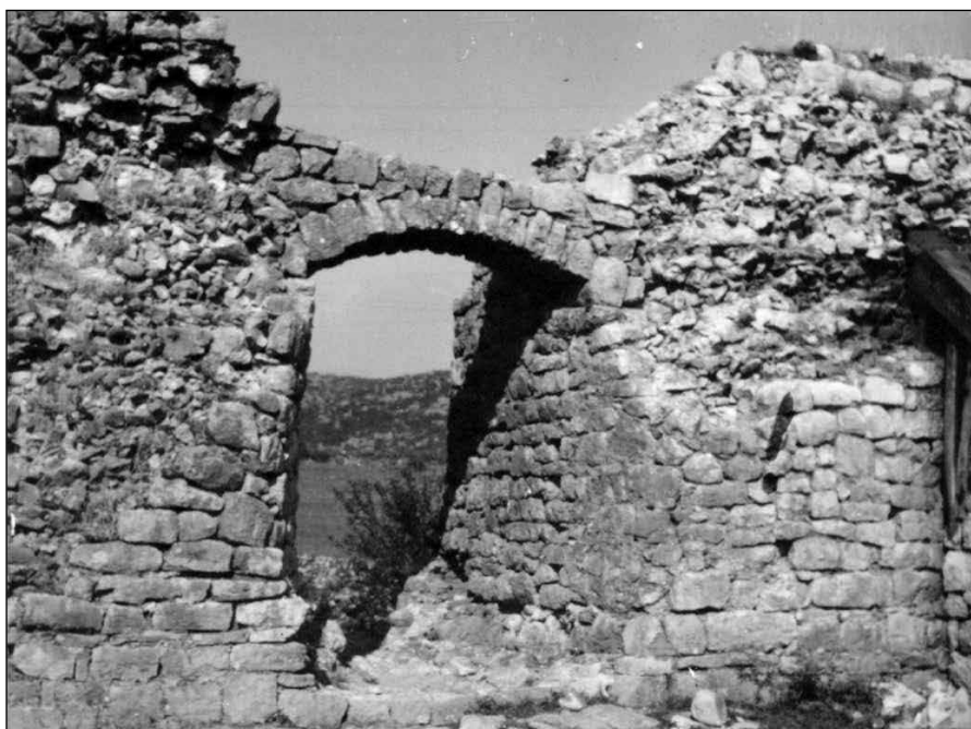
Сл. 3 Капија на сјеверном бедуу Дукље.

Међутим, проблем остаје на другој страни. У неразумљивој пасивности и немоћи институција, одговорних челника, државе, града на чијем се прагу све догађа.