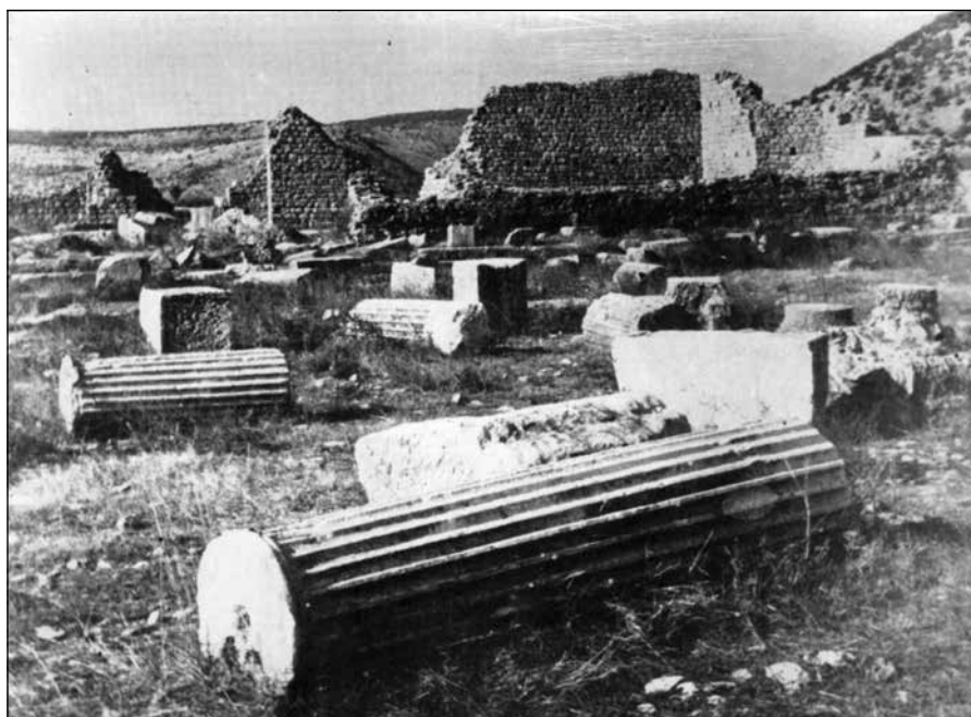
Сл. 5 Некадашњи изглед Дукље.

му. Држава, друштво, хтјели би да то ураде, али немају снаге и моћи да се изборе за сопствени историјски континуитет, тицао се он биолошког, духовног, културног и сваког другог интегритета, а то све припада и црногорском народу.