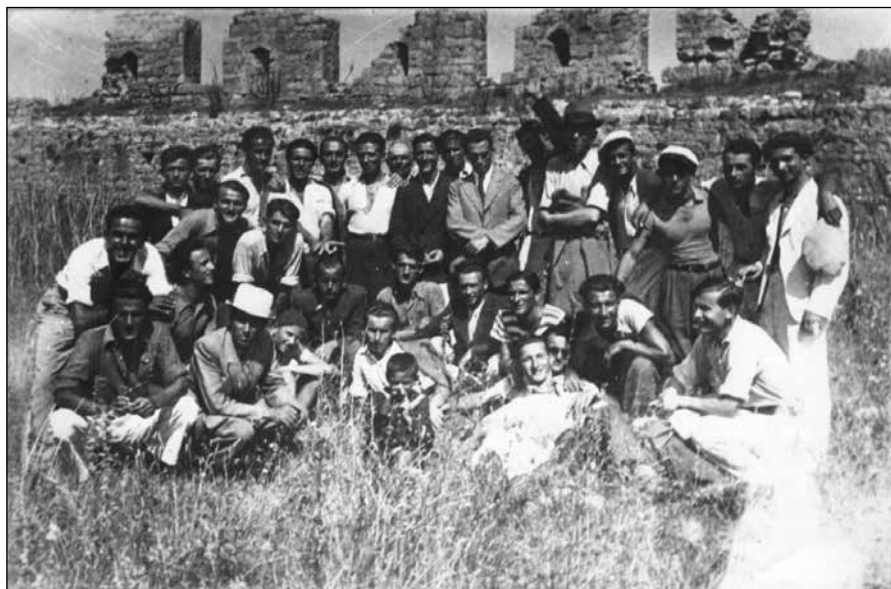
Сл. 1 Изглед зидина Дукље, између два рата.

земљу, свуда растиње, дрвеће, коров, доминирају гомиле камења, заостали шут на централној грађевини, форуму, од ископавања с краја 19. в.