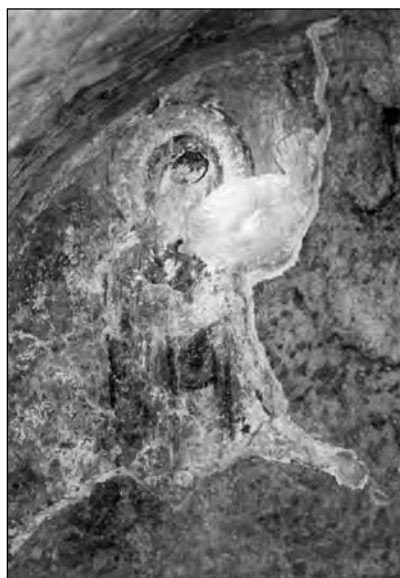
Сл. 4 Богородица из Деизиса, Сјеверна страна лунете аркосолијума

Свети Павле на сјеверној страни потрбушја лука је добро очуван (сл. 5). Представљен је фронтално и на себи има окер хитон и црвени химатион. Десна рука, покривена хи-