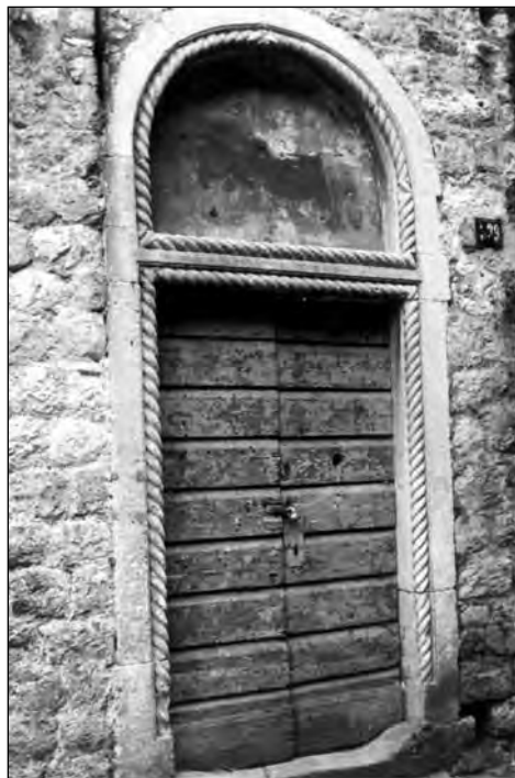
Сл. 2 Портал из XIII вијека инкорпориран у јужни дио дворишног зида

Западна фасада цркве је израђена од добро тесаних правилних квадера, постављених у хоризонталне редове приближно истих висина. У јужном дијелу се налази отвор портала који је дјелимично зазидан и претворен у прозорски оквир. Изнад портала је плоча са ктиторским натписом, уоквирена профилисаним вијенцем. Површина зида око пло-