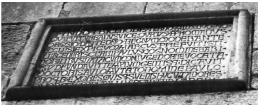
Сл. 1 Ктиторски натпис на западној фасади из XIII вијека

Натпис је уклесан капиталом, на правоугаоној мермерној плочи са профилисаним рамом, у десет правилних редова. Висина слова је уједначена, као и проред између редова.