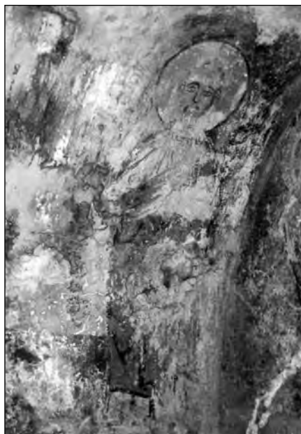
Сл. 5 Св. Павле, Сјеверна страна потрбушја лука аркосолијума

матионом, савијена је у лакту. Око главе има златни нимб оивичен мрком бордуrom. Фигура светог Павла је оштећена на лијевој руци и лијевом боку. Основни цртеж је мрке боје, а инкарнат је моделован тамним окером. Стопала фигуре светог Павла нијесу сачувана.