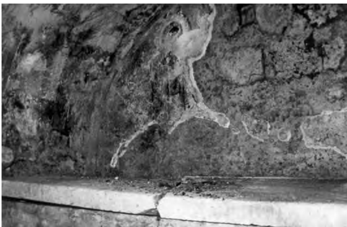
Сл. 3 Деизис у лунети аркосолијума из XIII вијека