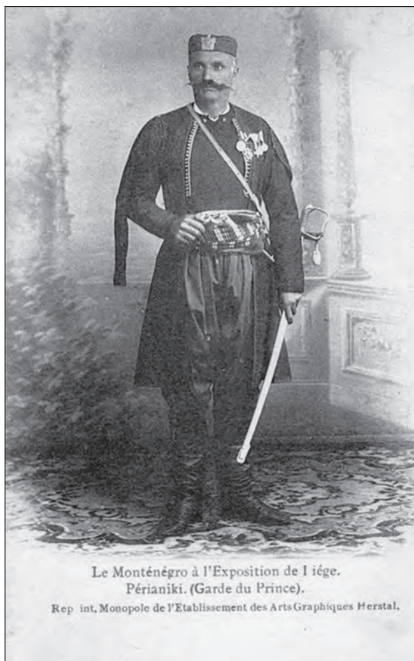
Сл. 6. Црногорски перјаник, Лијеж 1905.