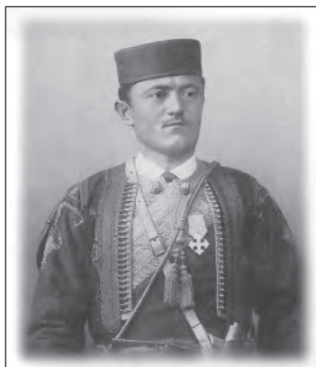
Сл. 2. Фотографија Црногорца са изложбе 1867. у Москви (О. В. Карпова, Н. Н. Прокопјева, Славянский мир. Этнографическая выставка 1867 года , Санкт-Петербург 2000, 61).