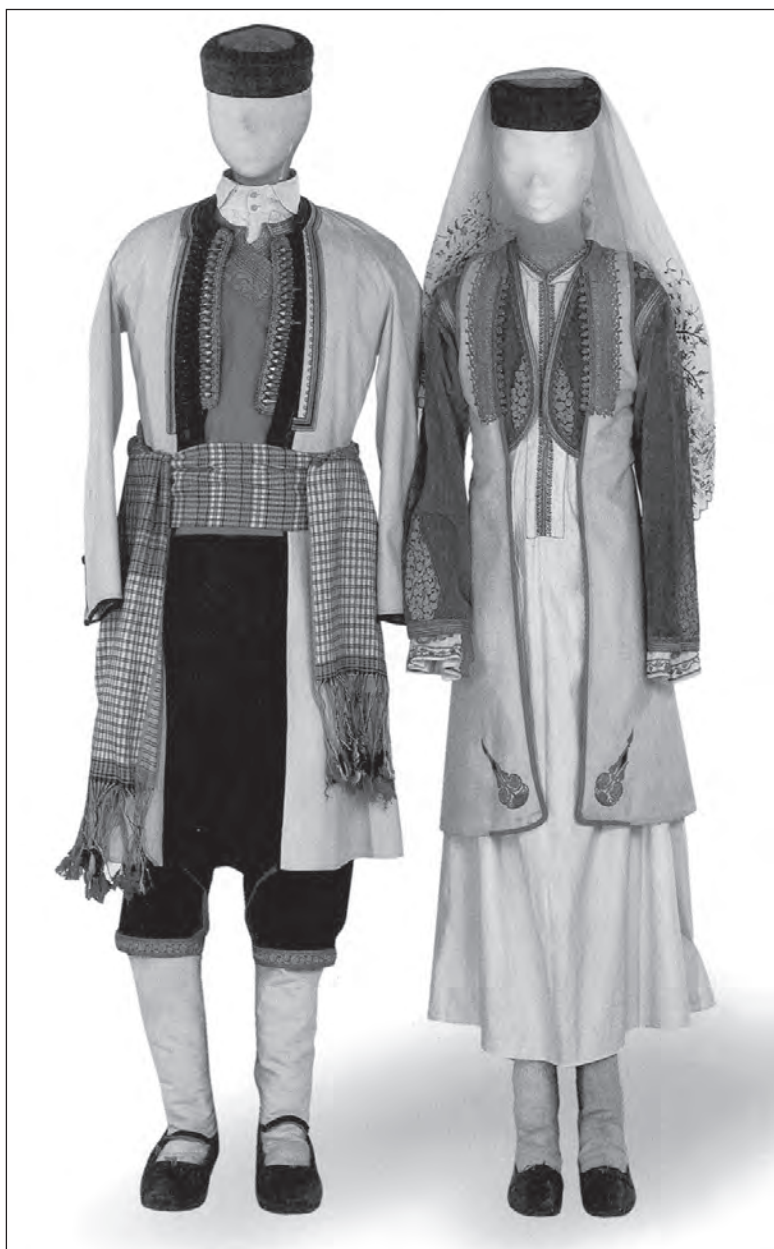
Сл. 1. Мушка и женска црногорска ношња изложена 1867. у Москви (О. В. Карпова, Н. Н. Прокопјева, Славјанскиј мир. Етнографическаја выставка 1867 года , Санкт-Петербург 2000, 60).