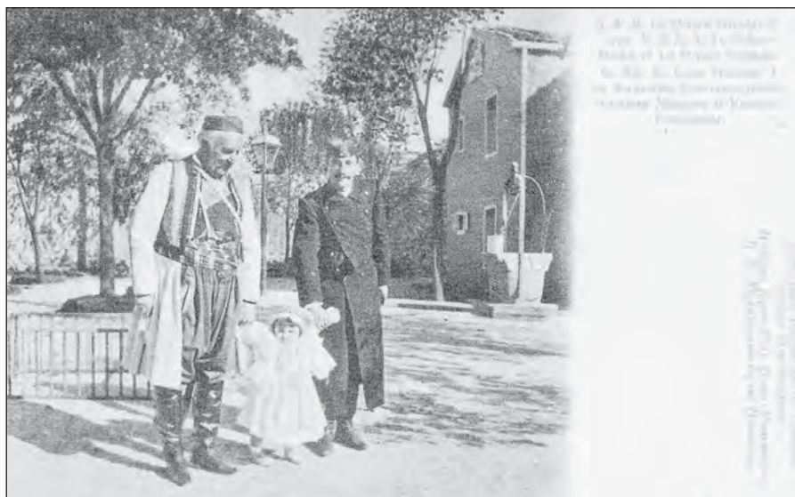
Сл. 7. Књаз Никола са принцем Мирком и унуком Стефаном, разгледница штампана за Балканску изложбу у Лондону 1907. (Црна Гора на старим разгледницама, Подгорица 2008, 48).