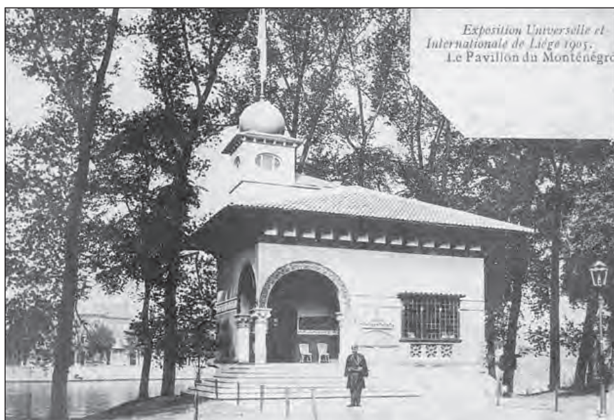
Сл. 5. Црногорски павиљон на изложби у Лијежу 1905.