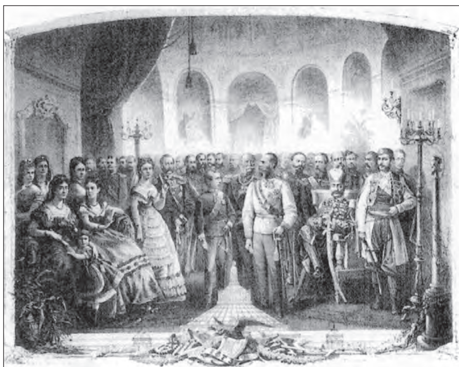
Сл. 3. Књаз Никола на пријему код аустријског цара Фрање Јосифа на Великој свјетској изложби у Бечу 1873.