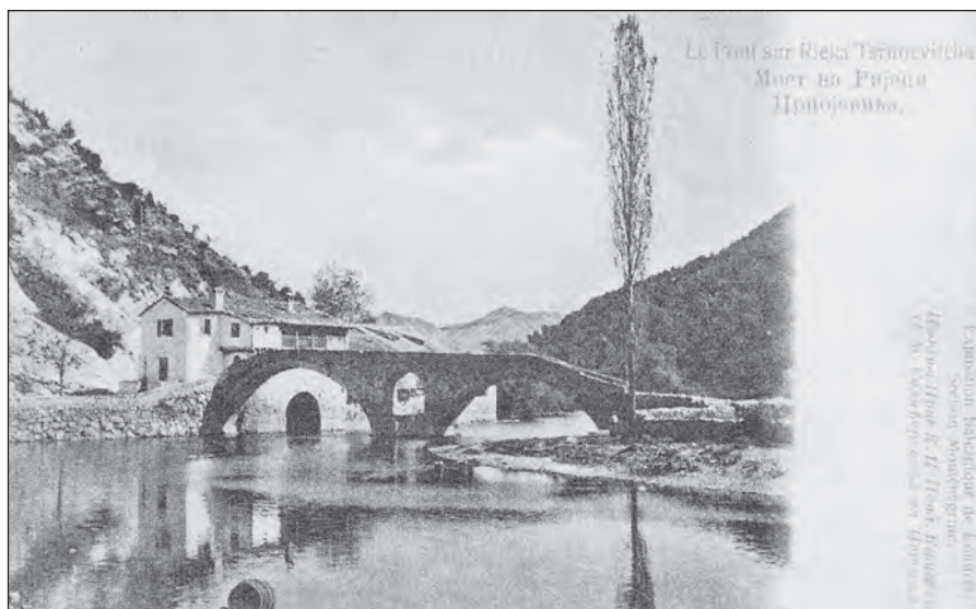
Сл. 8. Мост на Ријеци Црнојевића, разгледница штампана за Балканску изложбу у Лондону 1907. (Црна Гора на старим разгледницама, Подгорица 2008, 138).