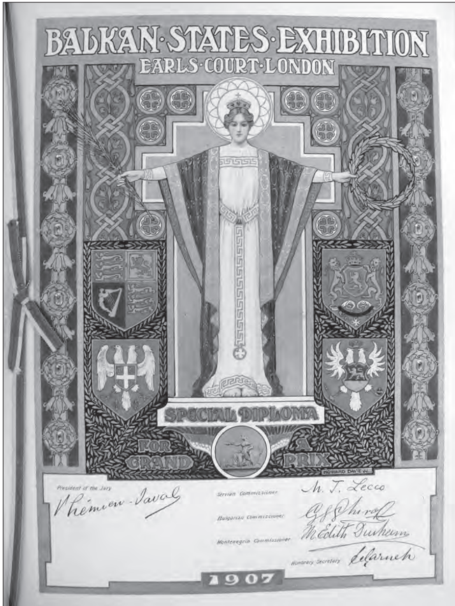
Сл. 10. Grand Prix диплома са Балканске изложбе у Лондону 1907. поклоњена књазу Николи.