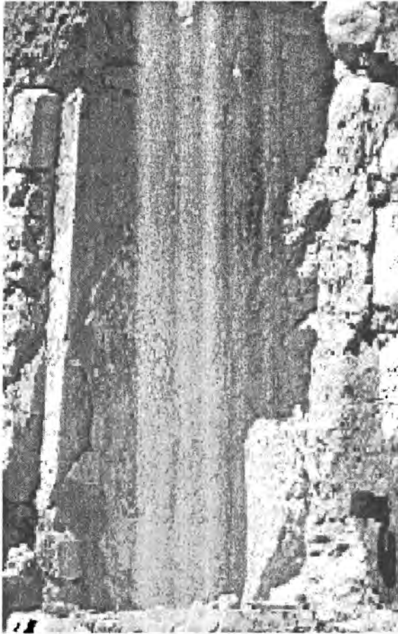
Fotografija 2. Sveti Hristofor, niša sjevernog zida zgrade br. 153