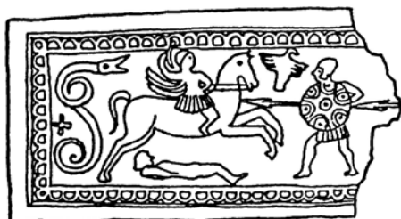
Цр. 2 - Плочица из Гостиља (гроб 126), према А. Јовановићу, Годишњак XXVII, 1989.