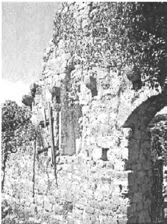
Fotografija 1. Sjeverni zid zgrade br. 153