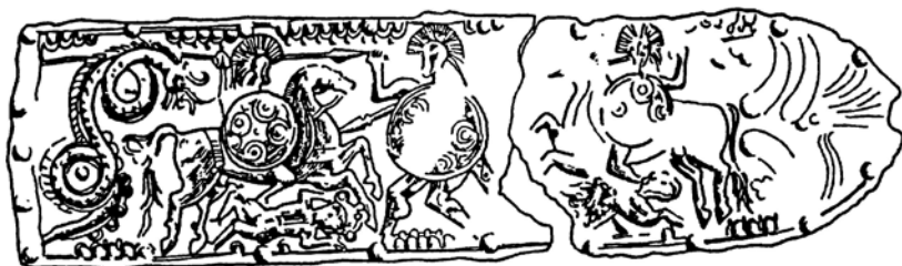
Цр. 1 - Плочица из Доњег Селца, Подградец, према А. Јовановићу, Годишњак XXVII, 1989.