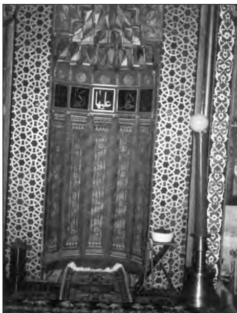
Сл. 4 Михраб Хусенин-пашине џамије са плитко рељефном декорацијом оквира

ово вријеме карактеристична је појава четири угаоне куполице које заједно са главном, средишњом куполом чине петокуполну грађевину и пљеваљска џамија је, највјероватније, током времена мијењала свој изглед. Треба поменути да "појава османских петокуполних грађевина, каква је у Евлијино време била и пљеваљска џамија, одмах изазива асоцијације на одређене споменике старе византијске архитектуре из доба Јустинијана, односно Василија I Македонског, или на српске репрезентативне петокуполне задужбине Милутиновог доба, и, позније, Моравске стилске групе...", мада "пажљивија анализа појаве четири угаоне куполице на исламским грађевинама XVI века на овом тлу показује да је она везана за шире токове развоја класичне стилске групе османске архитектуре". 16 Тако се ове куполице примјећују, између осталог, и на џамији Сулејмана Величанственог и на Селимији у Једрену. Имале су некад функцију статичког обезбјеђења, али су врло често примјењиване искључиво и као декоративни елеменат. О функцији ових куполица на Хусеин-пашиној џамији говори и Евлија Челеби, казујући да се ради о "укусним куполама". 19