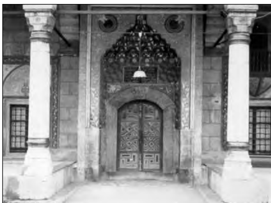
Сл. 6 Декорација изнад улаза која се понавља и на михрабу

За ову џамију већује се и израда Кур'ана изузетног богатства украса. Илуминирани Кур'ан из 16. вијека, који се чува у Хусеин-пашининој џамији у Пљевљима, извјесно спада међу најљепше рукописе сачуване код нас. Настао је 987. године по хиџри, односно 1579. године. О овом Кур'ану писао је Витомир Србљановић, наводећи детаљне податке о броју страница, броју редова, боји мастила, о 352 минијатуре рађене на златној подлози, одушевљен његовом љепотом и богатом илуминацијом 25 . Кур'ан је у кожном повезу с готово избрисаним украсом и величине 39x28,5 cm. Књига је дебљине 6 cm. Текст је исписан црним мастилом у 13 редова на 233 листа. Тачке су у облику позлаћеног цвијета. Минијатуре су најчешће у облику круга, круга са линијама извученим према горе и доље с троугластим украсом, или цвијета у зеленој, црвеној, плавој, црној боји. О преписивачу и мјесту израде рукописа још увијек нема сигурних сазнања (сл.7).