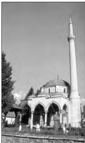
Сл. 1 Хусеин-пашина џамија

У првом раздобљу ширења ислама и арапских освајања затечене су бројне грађевине које су служиле као очигледни узор грађевинске и умјетничке вјештине која је примјењивана за потребе нове заједнице, тако да је на крају произашла умјетност, прилагођена условима различитих средина, позната под именом арапска, сараценска или исламска. Затечене богомоље мијењале су првобитну намјену. Омејадски владар ал-Валид претворио је у џамију цркву Св. Ивана у Дамаску, храм који су до тада дијелили хришћани и муслимани. Црква у Химсу истовремено је служила као црква и џамија. Исламска архитектура тог времена трпјела је у Сирији утицаје сиријско-византијског стила, у Перзији и Месопотамији несторијанске и сасанидске, у Египту коптске, у Индији хинду утицаје, у Кини будистичке. Михраб, удубина која показује правац молитве, уведен је за вријеме Омејада као додатак преузет од цркве. Домовина минарета је Сирија и увели су га Омејади. Два јужна минарета на Великој омејадској џамији у Дамаску заузела су мјесто старих торњева који су припадали цркви Св. Ивана; међутим, најстарији чисто исламски минарет је онај који је ал-Валид саградио на сјеверној страни џамије и који је касније служио као узор за друге грађевине ове намјене. За Куполу на