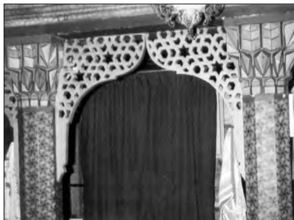
Сл. 5 Дио каменог махвила на коме се укрштају шестокраке звијезде и хексагони

Поменуто асоцијацију на српске задужбине износи и Витомир Србљановић, примјећујући сродност елемената: "Као што се на манастиру Светој Тројици појављују неки муслимански елементи, тако се и на џамији појављују неки хришћански". 20 На основу тога доноси занимљив закључак да се оправка у манастиру Св. Тројица вршила у вријеме подизања џамије и да су овај посао обављали исти