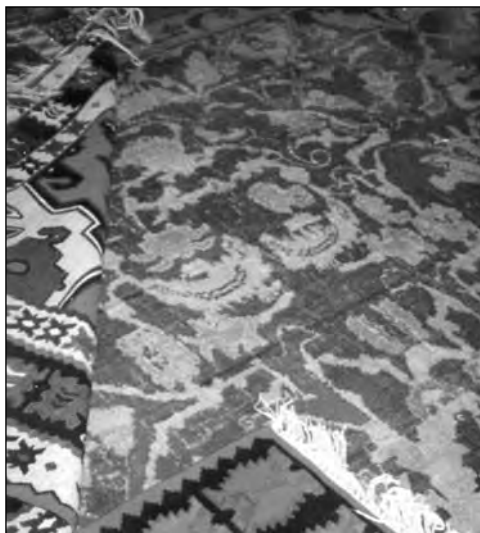
Сл. 3 Стари ћилим који прекривају ћилими ручне израде на којима доминира црвена боја

Куполице над михрабским зидом и јединство осликаних стилизованих флоралних мотива, геометријских облика урезаних у камен или дрво и калиграфски исписаних натписа на унутрашњим зидовима ("по вештини израде, лепоти и маштовитости спадају у ред најлепших декоративних целина у унутрашњости џамија код нас" 15 ) чине ову џамију посебно карактеристичном. Застрта је ћилимима ручне израде, тканим у пљеваљском крају, на којима доминира црвена боја. Ови ћилими покривају други стари, истрошени ћилим за који се тврди да је више вијекова стар и да је управо од оних "хасура" које је Хусеин-паша "послао из Мисира" (сл.3) и које спомиње Евлија Челеби у свом путопису: "У овој џамији има још једна ријеткост која заслужује да се види: То су хасуре којима је џамија застрта; њих је Хасан-паша (Хусеин-паша, иприм.а. ) послао из Мисира у Сулејман-ханово доба. То је таква врста хасуре да она и данас стоји онако умје-