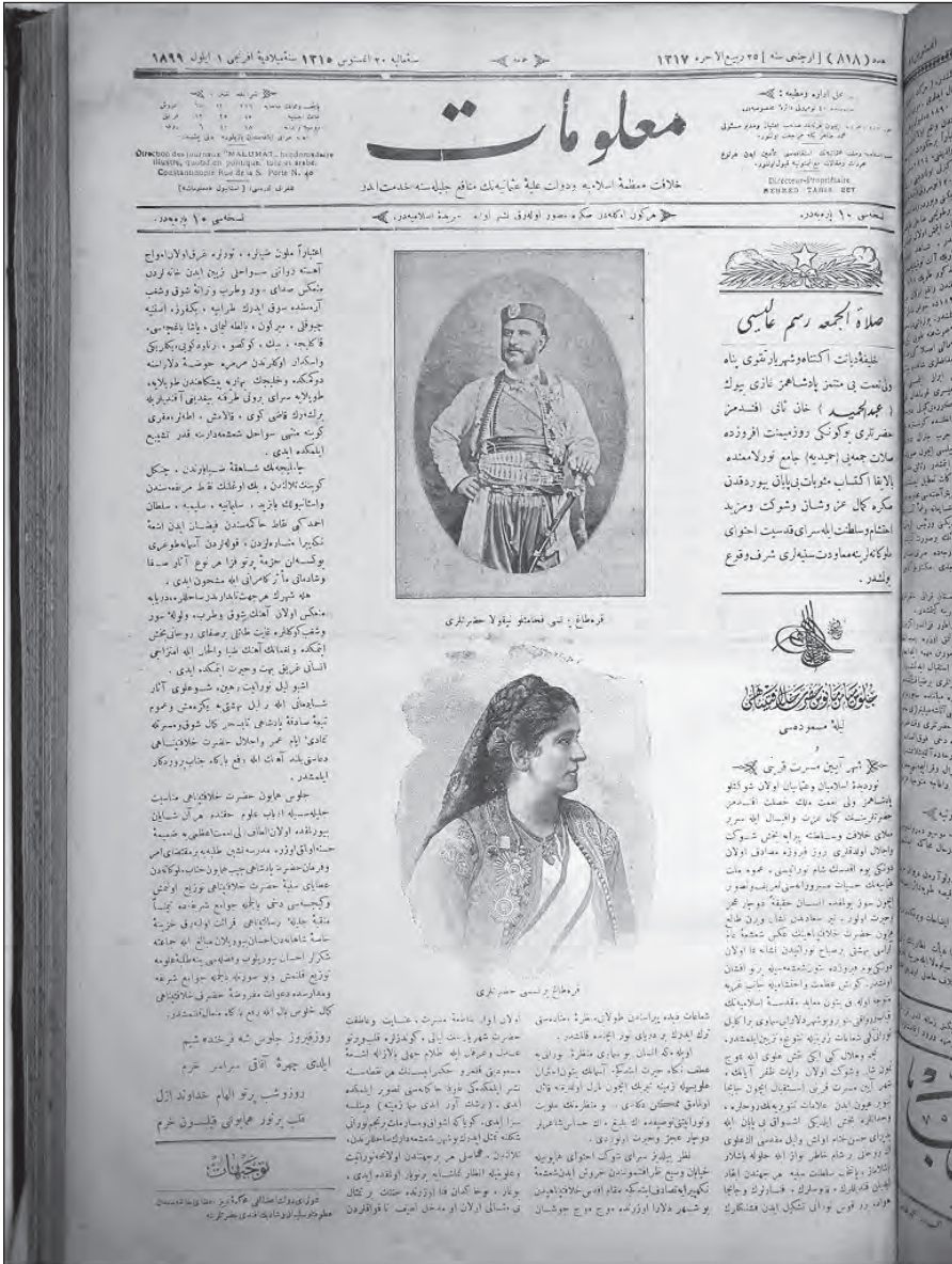
Фотографија 2: Малумат, број 818, 25. Ребиул-ухра 1317, 20. Август 1315, 1. Септембар 1899. године. Фотографије Књаза Николе и књегиње Милене поводом приспијећа у Истанбул.