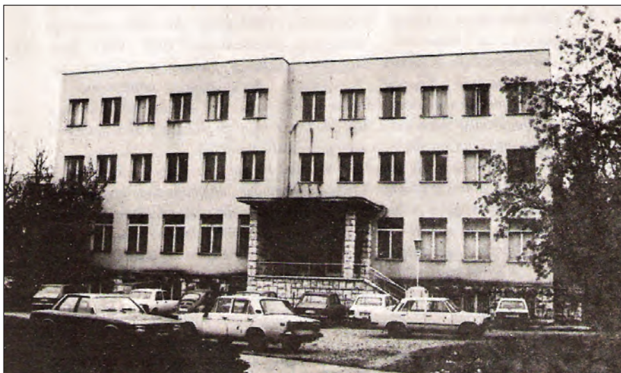
Историјски институт Црне Горе, 1991.

Он је направио систематски научни увид у црногорску повијесницу. Његови кадрови су одржали истраживачки и научни интегритет. Нијесу се повлачили у кулу од слоноваче и нијесу губили свој кредибилитет. Зато ни убудуће независност Историјског института Црне Горе не смије никако бити доведена у питање. А то ће бити осигурано ако као и досада буде у крилу Универзитета, у чије темеље је уградио и себе, као један од пет оснивача, као и своје резултате рада, на обострано задовољство и понос.