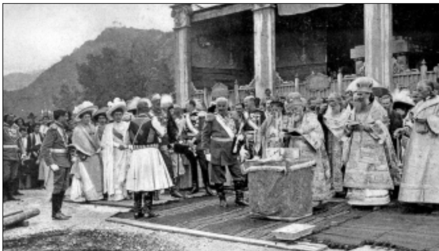
Сл. 2. Свечано полагање камена темељца за саборну цркву на Цетињу, 21. август 1910.

руске делегације коју је на свечаностима проглашења Црне Горе за краљевину предводио велики књаз Николај Николајевич (Сл. 2). 42 На положеном камену-темељцу писало је: "За владе краља Николе I подиже овај храм цар руски Никола II. 1910. августа 21." Локација за саборну цркву налазила се између Биљарде и Дома краљевске владе.