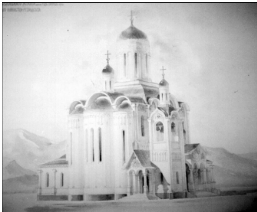
Сл. 1. Скица из пројекта за изградњу руског храма на Цетињу