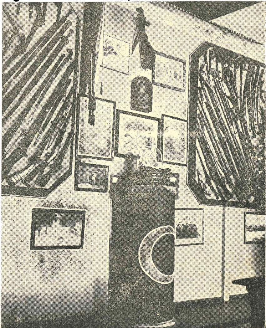
Сл. 2. Део Оружнице Државног музеја

а сами Црногорци толико пута били приморани чак и у другој половини XIX вијека да од најдрагоцјенијих докумената и рукописних и штампаних књига савијају фишке и од оловног ма-