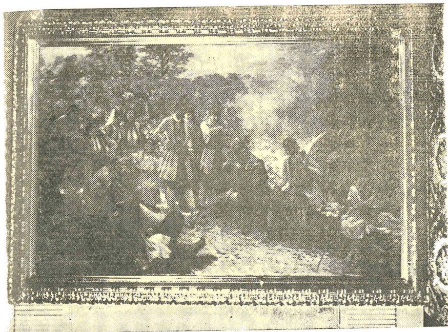
Сл. 3. Влахо Буковац, Црногорски гуслар

пане ствари, сем од разних трговачких протокола, формулара и позива, морају предати за Државну библиотеку по три примјерка, а неизвршење овога прописа кажњавало се »новчано од 100 до 300 круна, или затвором од 10 до 30 дана за сваки број, свеску и примјерак«. По буџетима, пак,