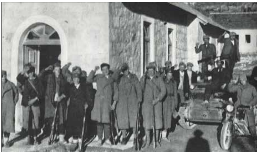
Grupa boraca nikšićkog odreda sa zaplijenjenim italijanskim tenkom na Vilusima 26. novembra 1941.