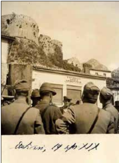
Botaj sa saradnicima u Starom Baru, 19. april 1941