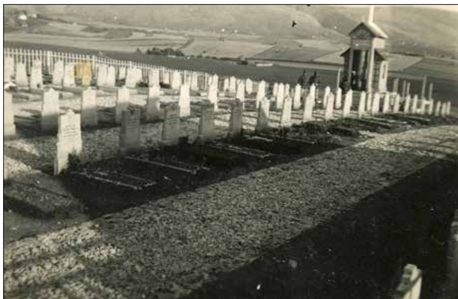
Groblje pripadnika italijanske divizije Pusterija u Pljevljima, decembar 1941, © Ecomuseo della Valsugana - dalle sorgenti di Rava al Brenta, Archivio fotografico