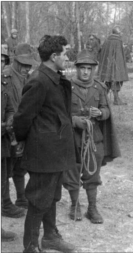
Zarobljeni partizanski vojnik, Pljevlja, 1. decembar 1941

vojnika divizije Pusterija koji su poginuli u Pljevaljskoj bici. 40