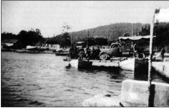
Italijanski kamioni u Boki Kotorskoj (Immagini ed evoluzione del corpo automobilistico, 1995)