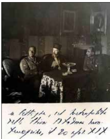
Botaj i Barkjezi sa mitropolitom Joanikijem Lipovcem, Cetinje, 20. april 1941

Serijska fotografija iz perioda april - maj 1941. godine, koja se odnosi na dolazak italijanskih motorizovanih jedinica u Crnu Goru, njihov transport iz Boke Kotorske i Albanije, nastala je aktivnošću vojnih fotografa. Čuva se u fondu Il Museo Storico della Motorizzazione Militare dell'esercito . 38