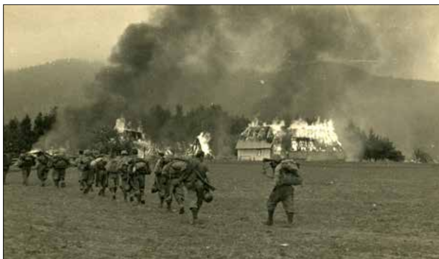
Paljenje kuća od strane vojnika divizije „Pusteria“, Pljevlja, 1. decembar 1941