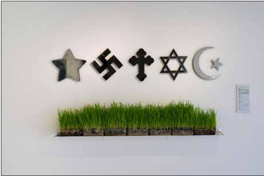
Anka Gardašević - Obraćaj mi se kao Svetosti

Da li sloboda umije lijepo da pjeva kao što mi i dalje pjevamo o njoj? Da li slobodom čovjek uvijek živi sebe, jer ona se ne postiže – slobodu nosimo u sebi? Da li tajna slobode počiva u hrabrosti? Da li je „naša borba“ rezultirala novom borbom – borbom bez prestanka? Da li su nam preci darivali slobodu ili su nas naučili da se za nju borimo? Što predstavljaju stvaralačka borba i stvaralačka sloboda? Kako „utuliti“ tjelesnu, duhovnu, intelektualnu glad? Što su žene u revoluciji dobile, za što su se izborile, a kakvim su osudama i predrasudama i dalje izložene? Da li je mir suštinski cilj kojim svi težimo?