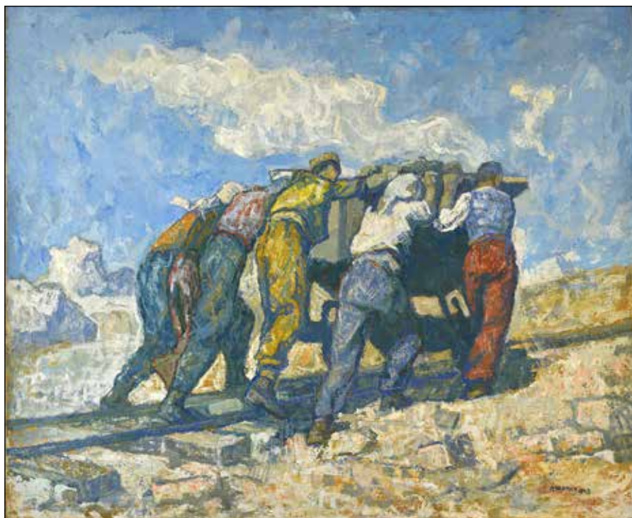
Petar Lubarda - Vagonet

cijalističkog vremena. Odisala je vjerom u „bolje sutra“, nerijetko produkujući vanredna djela naše istorije umjetnosti, grandizona ne samo po formatu (koji je bio podrazumijevan i tražen), već i po neupitnim umjetničkim kvalitetima. Umjetnost nije bila puki „reklamni izlog nove, postrevolucionarne vlasti“, 6 u kojem se prezentuju njena dostignuća – izgradnje pruga, fabrika, radne akcije, zemljani radovi, revolucionarna borba, herojski podvizi i slično... Bila je mnogo više od toga. Uzimajući u obzir dati kontekst, krucijalno pitanje koje se nameće: „ Da li je umjetnost, u takvim prilikama uspijevala da se izdigne do svoje samobitnosti? “ ima potvrđan odgovor, shodno uvidu u dio ostvarenja, koji nam je omogućila prva izložba art-projekta Što je nama naša borba dala .