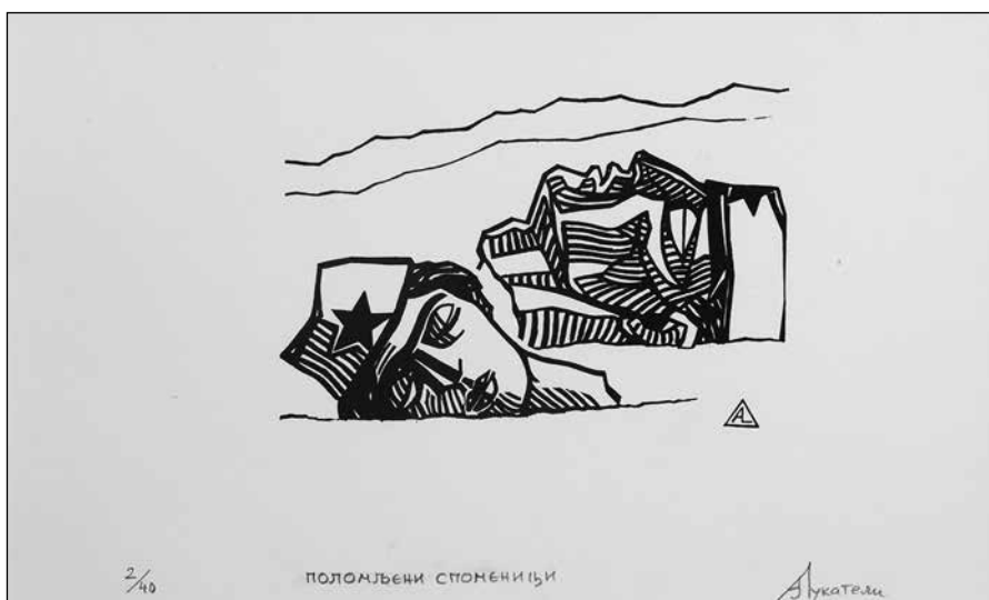
Polomljeni spomenici, Iz mape grafika za knjigu Takvi su bili Andrije Koprivice

objavljenom tekstu o Lukateliju. Nakon rata radio je ilustracije za Pobjedu, Omladinski pokret i Našu ženu. Koliko je sa jedne strane komunistička ideologija imala jak uticaj na umjetnika, a sa druge njegoševska tradicija, rječito govori i Lukatelijeva ilustracija / linorez „Njgoš i kolona partizana“ sa stihovima iz Gorskoga vijenca sa naslovne strane petog broja Pobjede iz 14. decembra 1944. Kako kult Tita još nije bio zaživio van redova i simpatizera NOB-a, komunistima je trebala ličnost sa velikim uporištem u tradiciji, kako bi privukli široke narodne mase, a to je, nesumnjivo, bio Njgoš. Lukateli preuzima ikonografiju najpoznatijeg sovjetskog propagandnog plakata iz Drugoga svjetskog rata koji je masovno distribuiran tokom odbrane Moskve, a na kome Staljin nadvisuje Kremlj i izdaje naredbu da se krene na Njemece. Njgoš, koji donekle asocira i na lik Marksa, koji ikonički i semantički veličinom nadvisuje ostatak kompozicije, prikazan je poput božanstva koje sa odobravanjem prati partizansku kolonu, dajući borcima i na simboličkom nivou potvrdu i legitimitet herojske borbe za slobodu, duboko ukorijenjene u narodnoj svijesti.