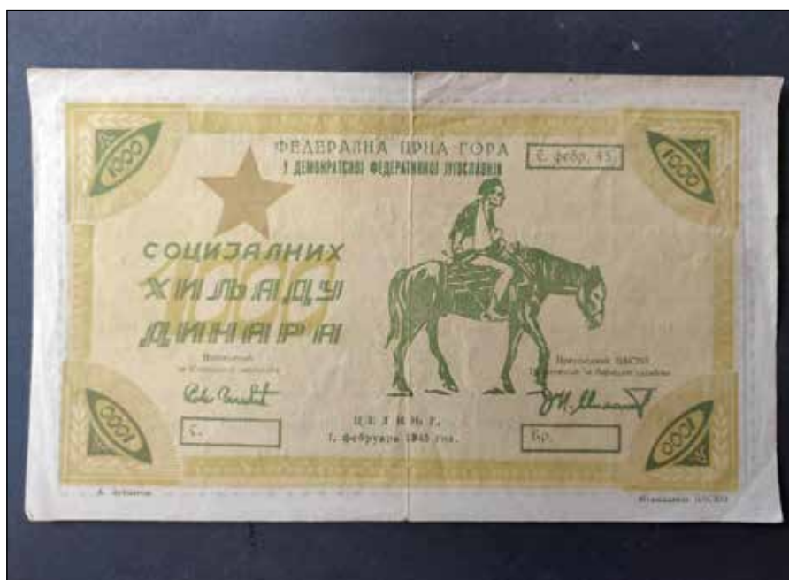
1000 socijalnih dinara, 1945

kontekst tog vremena i istorijsko-društvene okolnosti, kada se u umjetnosti, a naročito u disciplini grafike, insistiralo na balansu između propagande i likovnog izraza. Prve godine nakon Drugog svjetskog rata obilježili su revolucionarni zanos, duh kolektiviteta, vjera u ideal napretka i istorijsku misiju socijalističkog društva. Zemlju porušenu u ratu trebalo je izgraditi, stvoriti novo, pravедno društvo za novog čovjeka. Na ispunjenju tog istorijskog zadatka država je ujedinila i mobilisala aktere iz svih sfera, tražeći od svih protagonista posvećenu odanost proklamovanim ciljevima i neupitnu vjeru u put koji je Komunistička partija zacrtala. Od umjetnosti se zahtijevalo da angažovano i zajedno sa drugim činiocima doprinosi ravnopravnosti, bratstvu i jedinstvu, da bude usmjerena ka temama preko kojih se najučinkovitije mogao izraziti revolucionarni program i ljevičarske ideje, da zapravo bude „ideologija u slikama“. Jedan od imperativa je bio raskid sa predratnom umjetničkom tradicijom koja je smatrana reakcionarnom, a uzori su do 1948. godine i Rezolucije Informbiroa traženi u sovjetskim primjerima u koje, što je malo apsurdno, nije bilo dovoljno neposrednih uvida. Insistiranje na sadržaju koji je lako razumljiv i koji je trebalo da ima vaspitno-ideološki karakter, nasuprot formi, moglo je, između ostalog, biti i posljedica toga što su se likovnom kritikom, teorijskim i poetičkim pretpostavkama u to vrijeme skoro isklju-