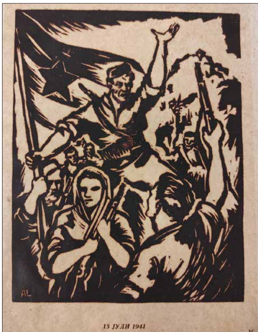
13 juli 1941, iz mape grafika, 1946

čivo bavili književnici. Tako, skoro kao obavezujuće uputstvo umjetnicima u to vrijeme, Jovan Popović piše: „...ako treba prikazati fašistu, društvenog zločinca, predstavnika cinične buržoazije na vlasti... eksploatorske i ugnjetavačke klase – onda ta lica treba kritički osvetliti... A kada je reč o našem