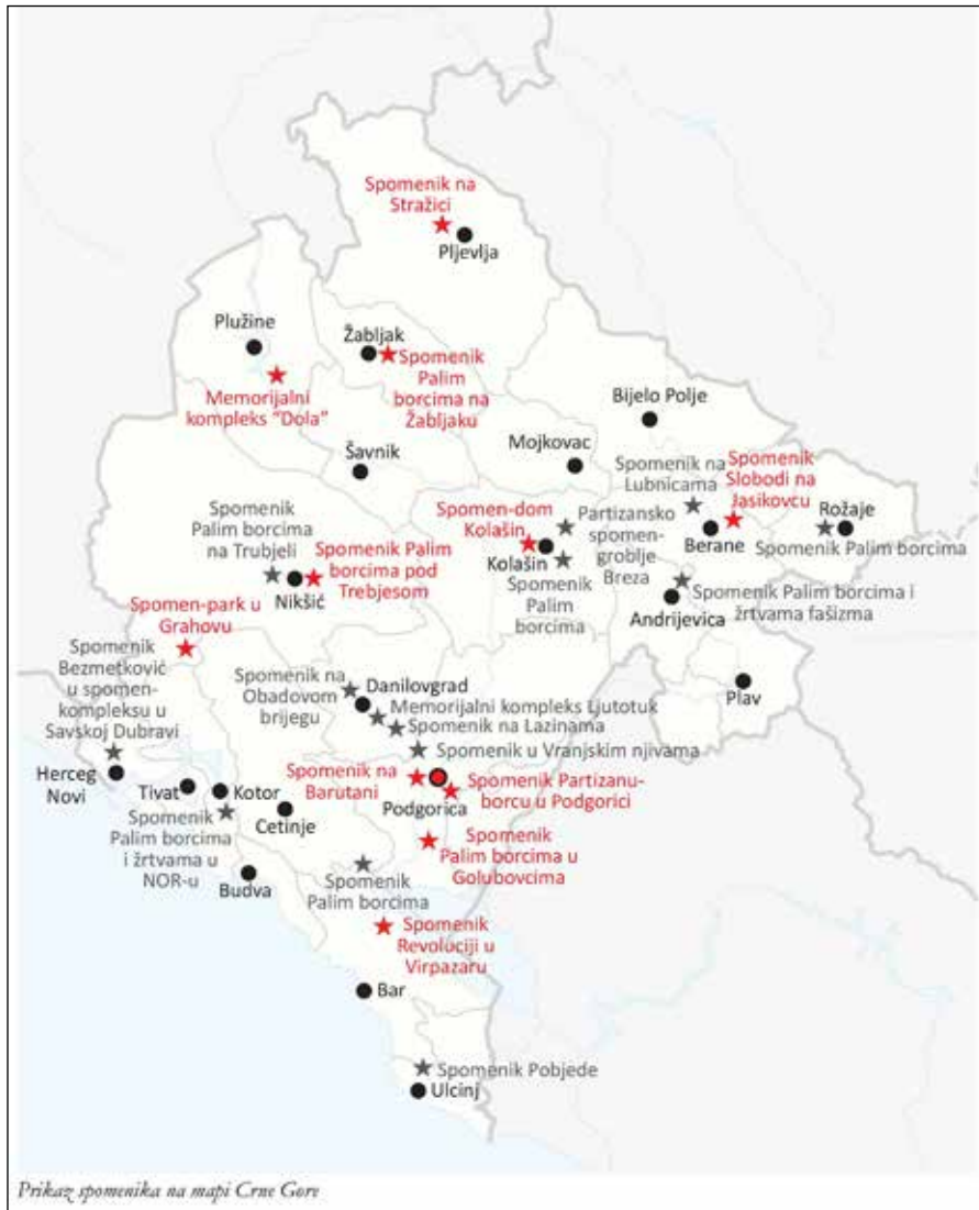
Slika 2. Lokacije 25 spomenika istraženih kroz regionalni projekat WWII-MonumnetSEE (2018–19), od čega je 11 detaljno obrađeno i prikazano u knjizi

Posmatrano hronološki, prvi impresivniji spomenik, otvoren na centralnoj republičkoj proslavi ustanka 13. jula 1957. godine, je Mauzolej Partizanu- borcu na brdu Gorica u Podgorici , u kome se nalaze posmrtni ostaci 66 narodnih heroja NOR-a i dvojice revolucionara. Spomenik je i neka