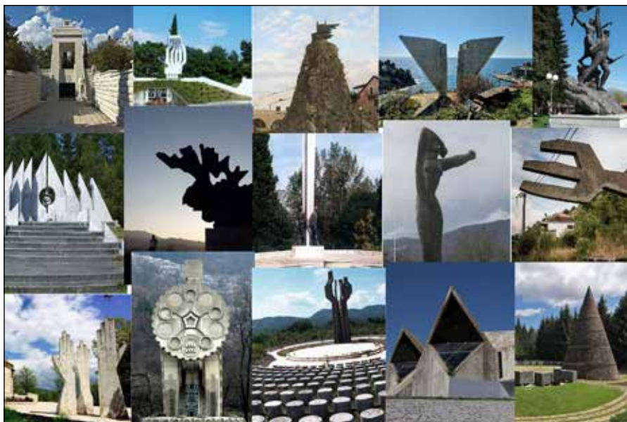
Slika 1. Neki od najznačajnijih spomenika posvećenih Drugom svjetskom ratu u Crnoj Gori

Među ovim spomenicima posebno se mogu izdvojiti oni koji su podignuti u znak sjećanja na ustanički period i prve otpore fašističkoj okupaciji 1941. godine, kao i oni koji su svečano otvarani upravo na dan ustanka 13. jul, često u okviru velikih republičkih centralnih proslava.