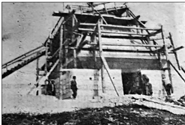
Slika 5. Spomenik na Žabljaku, 1963. Članak iz dnevne štampe o izgradnji spomenika.

kode opisivani radovi na spomeniku: „... spomenik će biti visok devet i po metara. Unutar postamenta nalazi se prostorija veličine 6 sa 3 i po metra a visine 6 i po metara...“ 12 . Autori spomenika su hrvatski arhitekta Branko Bon (1912–2001) i akademski vajar Radeta Rade Stanković (1905–1996). 13 Po nezvaničnim informacijama, ideju za izgradnju spomenika dao je, posljednjih dana svog života, slikar, novinar, likovni kritičar i revolucionar, narodni heroj Moša Pijade (1890–1957). Spomenik-mauzolej je finansiran dobrovoljnim priložima stanovništva tog kraja.