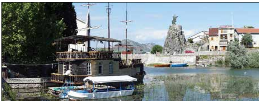
Slika 4. Spomenik Revoluciji u Virpazaru – pejzaž.

ski vajar Mirko Ostoja 11 . Spomenik je postavljen na prirodnom uzvišenju, stijeni koja se nalazi kod glavnog mosta u Virpazaru (Virski most), na ostacima kule-osmatračnice (tzv. Njegoševa kulica), tako da vizuelno dominira okruženjem. Izliven je u bronzi i predstavlja dva borca za slobodu sa oružjem u rukama, u vihoru ustaničkih dana. U likovnom izrazu i oblikovanju se može uočiti umjetnički jezik karakterističan za tzv. socijalistički realizam, aktuelan 50-ih godina u bivšoj SFRJ. Izrazita dinamičnost forme postignuta je ekspresivnim stavom figura, a dodatno pojačana naglašenim linijama „vjetra“ u pozadini, što jasno simbolizuje „vihor ustanka“. Izgradnju spomenika finansirali su stanovnici Crmnice uz pomoć društvene zajednice.