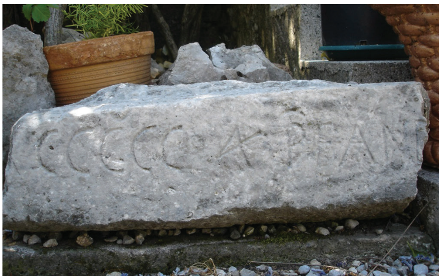
Sl. 5. Nadvratnik sa natisom pronađen 1901. god.