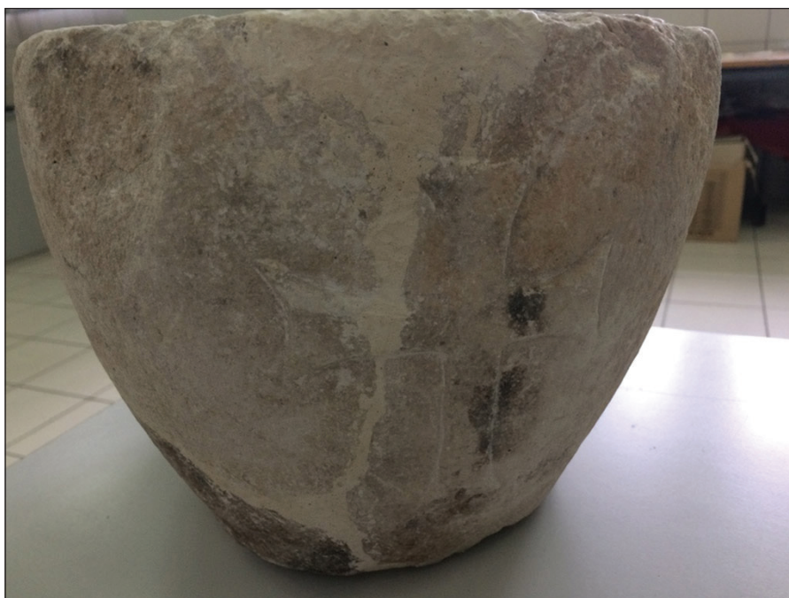
Sl. 6. Agiazma dekorisana plastično isklesanim krstom