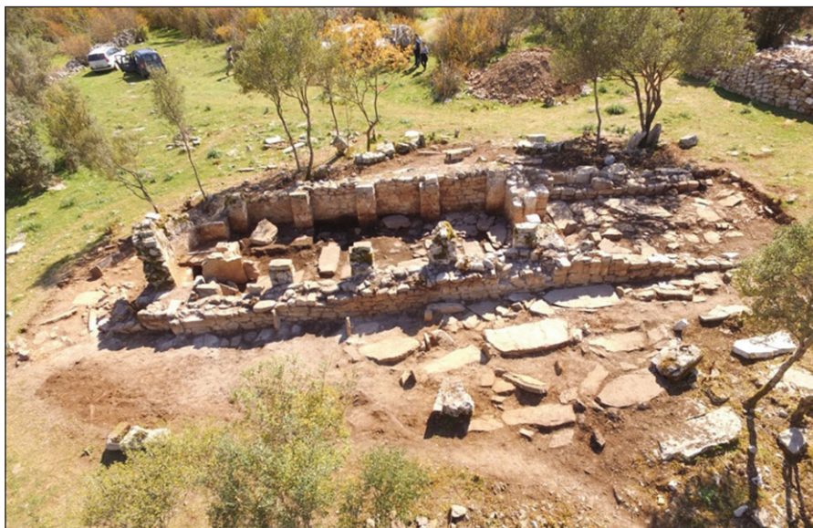
Sl. 3. Foto osnove crkve