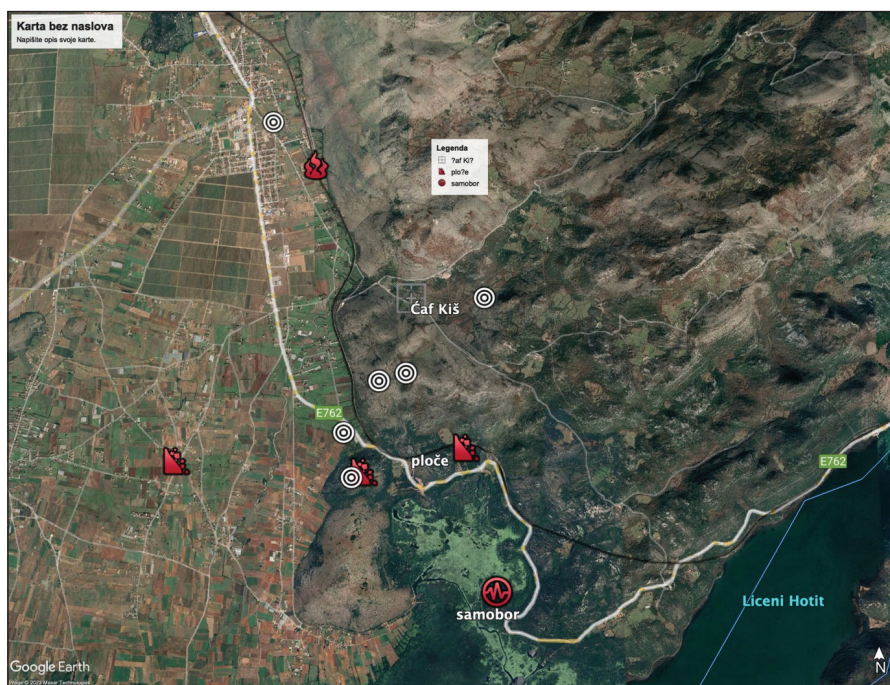
Sl. 6. Arheološka nalazišta u okolini crkve Čaf Kiš