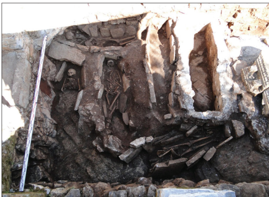
Sl. 4. Nekropola unutar zapadne polovine naosa (sa grobnicom br 3)