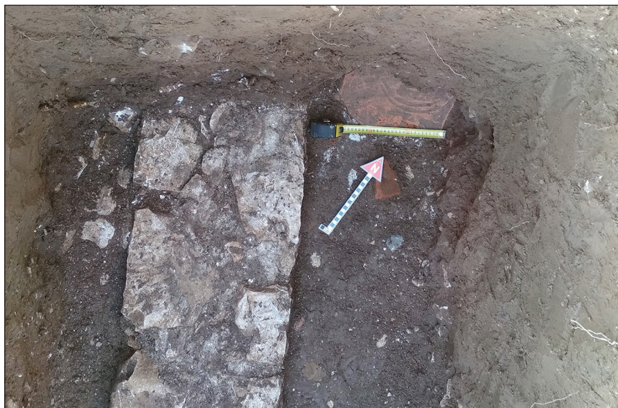
Slika 6. Tehničko snimanje tegule u profilu sonde