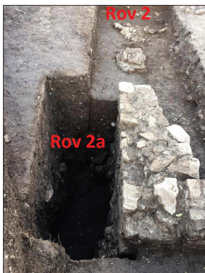
Slika 2. Pozicije rovova 2 i 2a