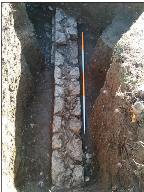
Slika 5. Dio zida u test sondi 1

Na kraju, može se zaključiti postojanje srednjovjekovne crkve, ali se ne može preciznije datovati zbog sporadičnih pokretnih nalaza u istraženoj površini, karaktera istraživanja i ograničenih rokova za njihovu realizaciju. Sjeverno od ostataka crkve, na udaljenosti od 5 metara, pronađen je dio zida objekta nepoznate namjene. Malobrojni pokretni nalazi su datovani u vrijeme V-VI, XIV i XVII vijek.