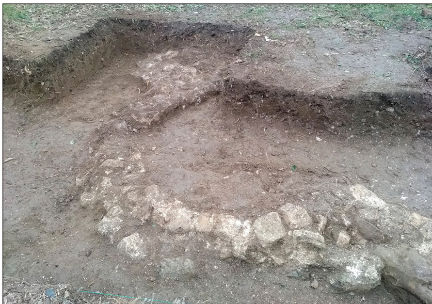
Slika 1. Ostaci apside crkve u Zaljevu

koje čini 10 redova poluobrađenog i neobrađenog kamena spojenih krečnim malterom visine 0,97 m. Temeljnu zonu čini tri reda neobrađenog kamena sa sporadičnom pojavom opeke, koji su spojeni krečnim malterom visine 0,92 m. Ispod temeljne zone nalazi se sloj šuta.