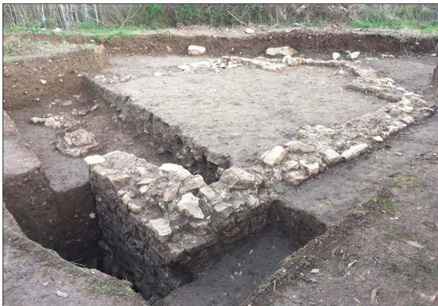
Slika 3. Opšti izgled crkve